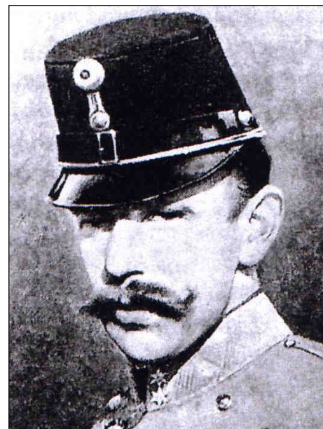
Toto je jedna z posledních fotografií následníka trůnu. Rudolf ležel v žaludku celé mocenské hierarchie. Revolverové deníky se předháněly v pomluvách (i když na každém šprochu pravdy trochu) o jeho milostných aférách s tanečnicemi, manželkami togských obchodníků

Kde přišel k této obrovské sumě? Na hotovosti ani v bance ji neměl. Že by mu snad půjčil jeho císařský strýček? Ani náhodou. V prvé řadě ani on takovou sumou na hotovosti nedisponoval a za druhé je František Josef známý držgrešle a těžko by svému synovci, kterého navíc neměl příliš v lásce takové peníze na rozmařilé nákupy půjčil, natož to věnoval. Výnos z majetku zděděného spolu s titulem De Este byl mizivý. Většinu si navíc v restituci přisvojili Italové. Jak jsou zdroje tohoto původního kapitálu? Jsou od českých průmyslníků, kterým slíbil větší národní práva? Nebo od tajemných dárců-maharadžů z Indie, které kontaktoval při svých cestách? Nebo od amerických miliardářů, kteří se chystali na expanzi do Evropy, a kterým slíbil poskytnout nejružnější výhody na obrovském rakousko-uherském trhu? Zatím jsou to jen dohady na které se při obvyklé „upřímnosti“ Habsburků těžko dočkáme odpovědi.