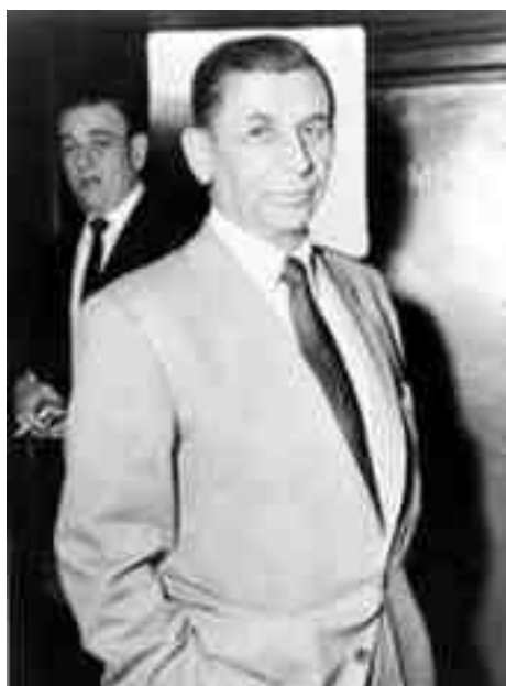
Meyer Lansky konečně získal americké občanství - blahopřejeme