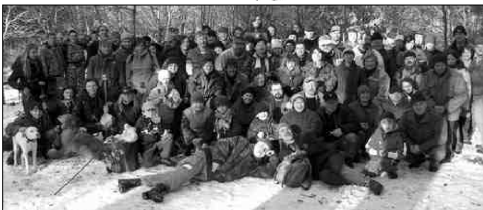
Již tradiční Štěpánský pochod