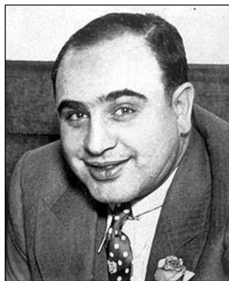
Poslední dobou bývá Al Capone často terčem útoků, několikrát se jej pokoušeli i zabít, neúspěšně

alespoň zdání této lásky nabídl. Tak velká rodina Čičů po pět generací vytvářela své impérium, dávala statisícům Američanů ve městech i na venkově chvilkové pocity radosti a štěstí. A když v roce 1920 prezident Wilson vyhlásil nesmyslný zákon o prohibici, věnoval dnešní Don Čičo všechny své síly, aby neochudil miliony Američanů o potěšení z doušku chladného piva či zlatožluté whisky. Rodina stále odolává nepřízni úřadů policie a konkurence. Svě malé zisky věnují na bohubilé účely jako je právě sponzorování této knížce a jejímu křtu.